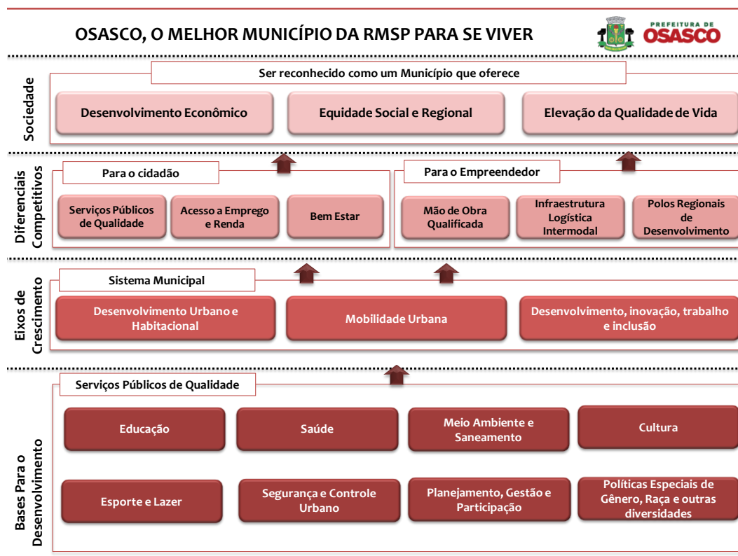
Figura 1 – Mapa Estratégico da Prefeitura de Osasco/SP

O Mapa Estratégico da Prefeitura de Osasco 2014-2017 (Figura 1) é uma agenda comum que envolve responsabilidades para as equipes de todos os órgãos do poder executivo municipal. Foram constituídos a partir de uma visão de futuro para a cidade focada nos seguintes atributos: desenvolvimento econômico; equidade social e regional e elevação da qualidade de vida da população. No Mapa está representada a relação entre os eixos temáticos, objeto dos acordos de resultado e a visão de futuro almejada para a cidade.